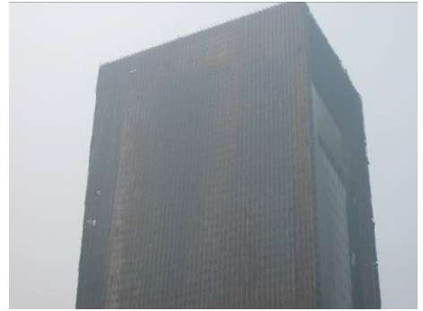
Fig.8 高層部の被害状況(東側)