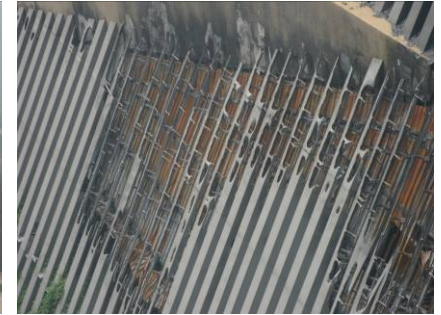
Fig.11 外装材の火害状況