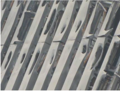
Fig.12 外装材の火害状況 4