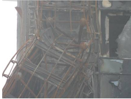
Fig.13 スペースフレームの状況