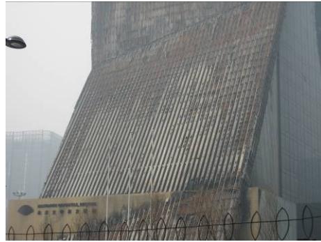
Fig.7 低層部の火害状況(東側)