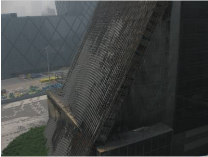
Fig.9 外装材の火害状況(北側)