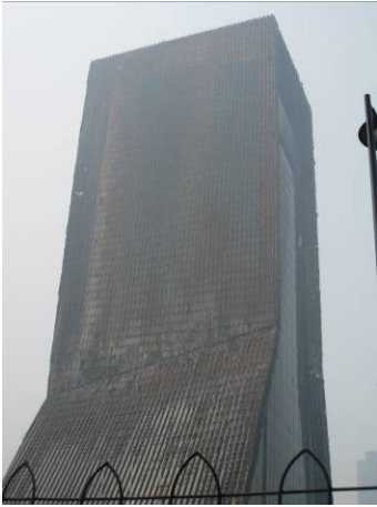
Fig.6 TVCC 全景(東側)