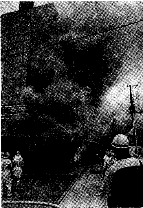
写真(1) 洞道から猛煙を噴きあげる世田谷電話局の電話ケーブル火災